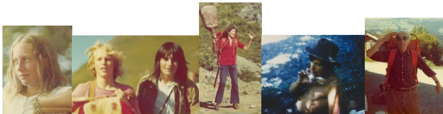
Schulreise 1973 mit der 9. Klasse

(Mode Reporter „Johann“, aus Modejournal 9. Klasse 1971)