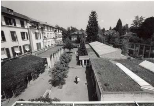
Blick gegen Muristrasse 12