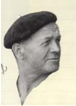
Hauswart von 1953 - 1982