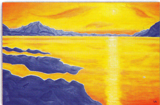
«JAUNE D'OR-BLEU SANS FRONTIÈRES» 81x54 cm, huile sur toile, 2009. Leiestyem

Cotations: 1.600,00 €, (24x17x20)cm, huile sur toile; 2.000,00 €, 28x20x19, bronze.